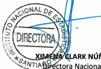
XIMENA CLARK NÚÑEZ Directora Nacional Instituto Nacional de Estadísticas

Sin otro particular, saluda atentamente,