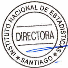
XIMENA CLARK NÚÑEZ DIRECTORA NACIONAL INSTITUTO NACIONAL DE ESTADÍSTICAS