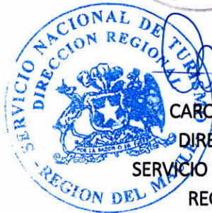
CAROLINA REYES BRAVO DIRECTORA REGIONAL SERVICIO NACIONAL DE TURISMO REGION DEL MAULE