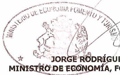
JORGE RODRÍGUEZ GROSSI MINISTRO DE ECONOMÍA, FOMENTO Y TURISMO.