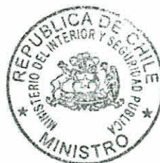
MARIO FERNÁNDEZ BAEZA MINISTRO DEL INTERIOR Y SEGURIDAD PÚBLICA

“POR ORDEN DE LA PRESIDENTA DE LA REPÚBLICA”.